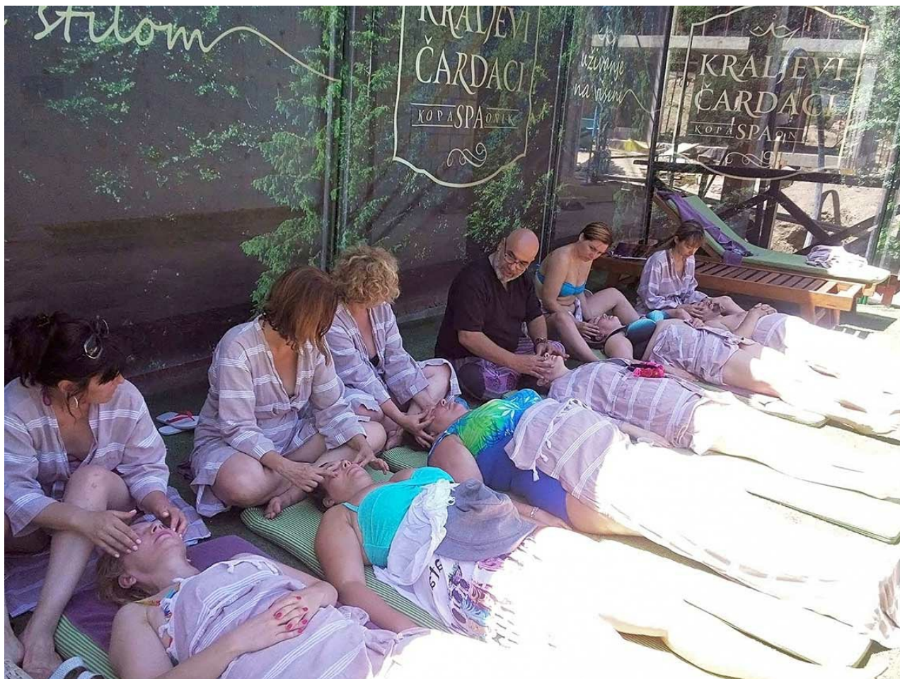
Aktivni odmor za čoveka 21. veka