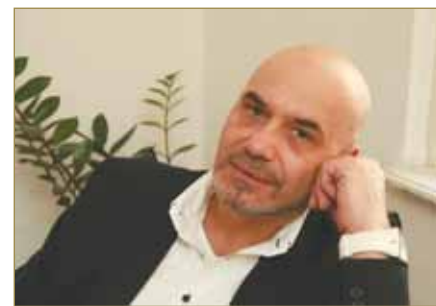
Piše: Pedja Filipović

Da li će se gosti osećati prijatno u wellness centru zavisi svakako od ambijenta, opremljenosti, kozmetičkih preparata i tretmana koje mogu da koriste, svetlosti, mirisa, zvukova... Ali, pre svega, složit ćete se, od stručnosti, ljubaznosti, pažnje i posvećenosti terapeuta. Iako se to podrazumeva, nije naodmet ponoviti da terapeuti treba ozbiljno da vode računa i o higijeni i o svom vizuelnom identitetu, kao i da poštuju određena pravila ponašanja, radne obaveze i etičke norme, što je sastavni deo bontona koji i njihovi klijenti treba da znaju.